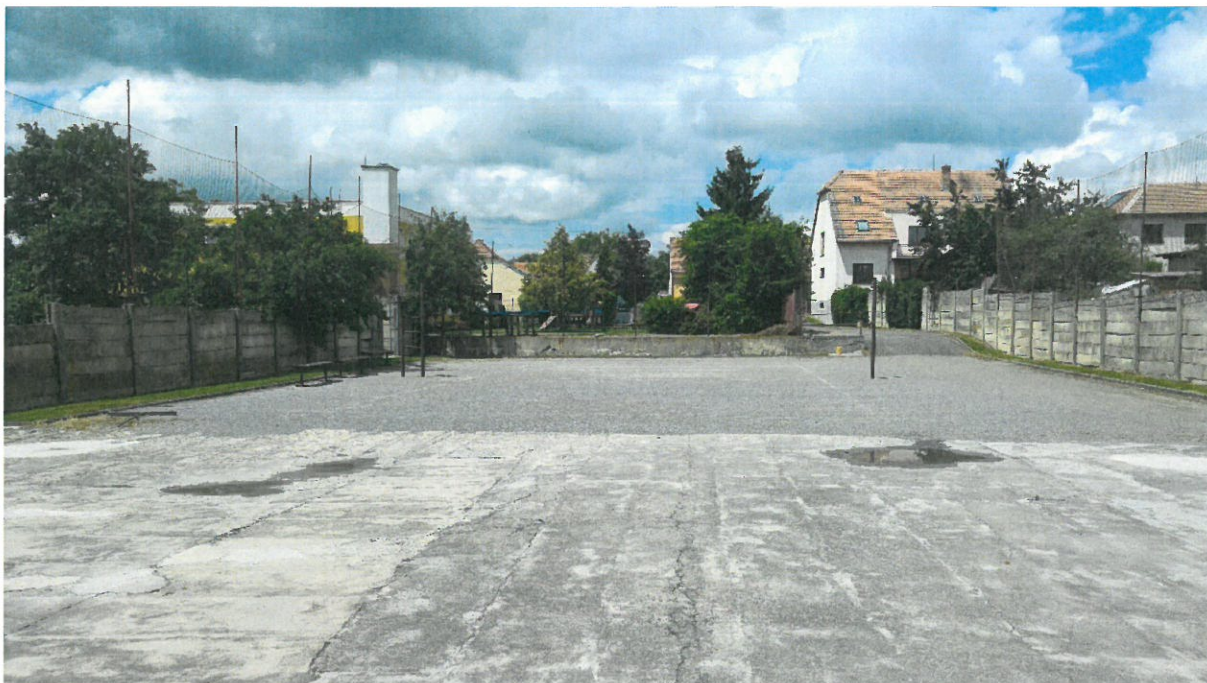
Foto: nohejbalové a volejbalové hřiště